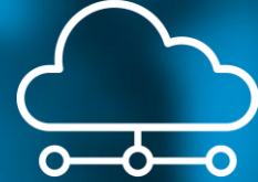
Managed Cloud Services